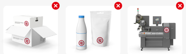
Empaques y embalajes

Esto incluye: etiquetas, envases, embalajes, certificados de calidad o de producto, resultados de test de calibraciones de equipo, en el producto.